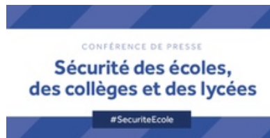
Sécurité des écoles, collèges et lycées