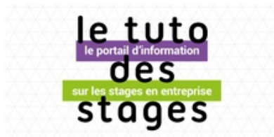
Le tuto des stages : le portail d'information sur les stages en entreprise