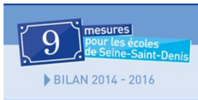
9 mesures pour les écoles de Seine-Saint-Denis : bilan 2014-2016