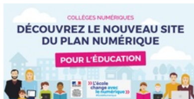
Tout savoir sur le plan numérique pour l'éducation